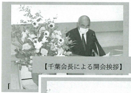
【千葉会長による開会挨拶】