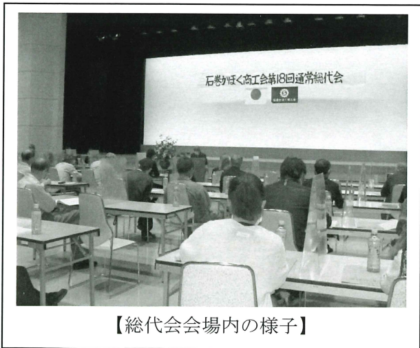
【総代会会場内の様子】