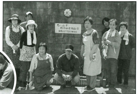
【青年部・女性部参加者】