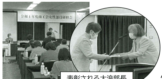
表彰される大浪部長